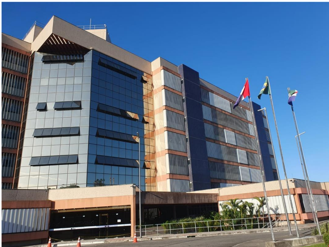
Prédio da Justiça Federal, na Av. Menino Marcelo, s/nº, em Maceió

1ª praça: 31 de março de 2025, às 09:00 horas